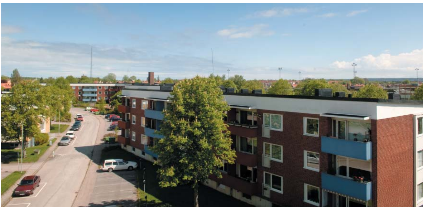
Kvarteret Vesslan - Roddaregatan 4-12

-Förbättrad tillgänglighet är en viktig fråga på Roddaregatan där vi vet att vi har en hög andel lite äldre hyresgäster.