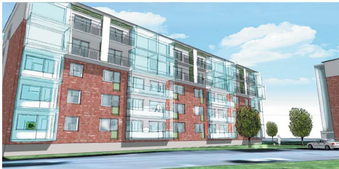
Förslag med ytterligare två våningar på Roddaregatan

- Det är ett jättespännande projekt som vi planerar att påbörja i april 2011. Idag har vi cirka 160 intressenter som löpande vill få mer information.