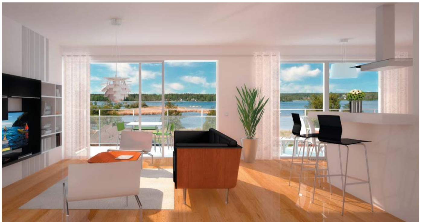
Interiörbild från lägenhet på 4:e våningen, Contekton Arkitekter