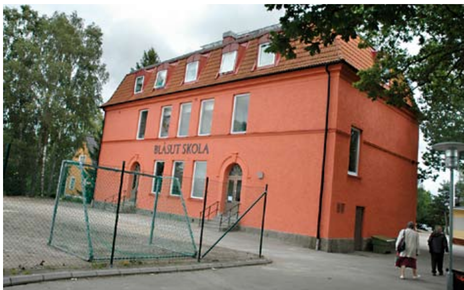
Skolan i Blåsut byggdes år 1912. Efterhand har den byggts ut med fler byggnader intill.