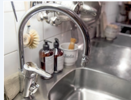
Nytt och fräscht!