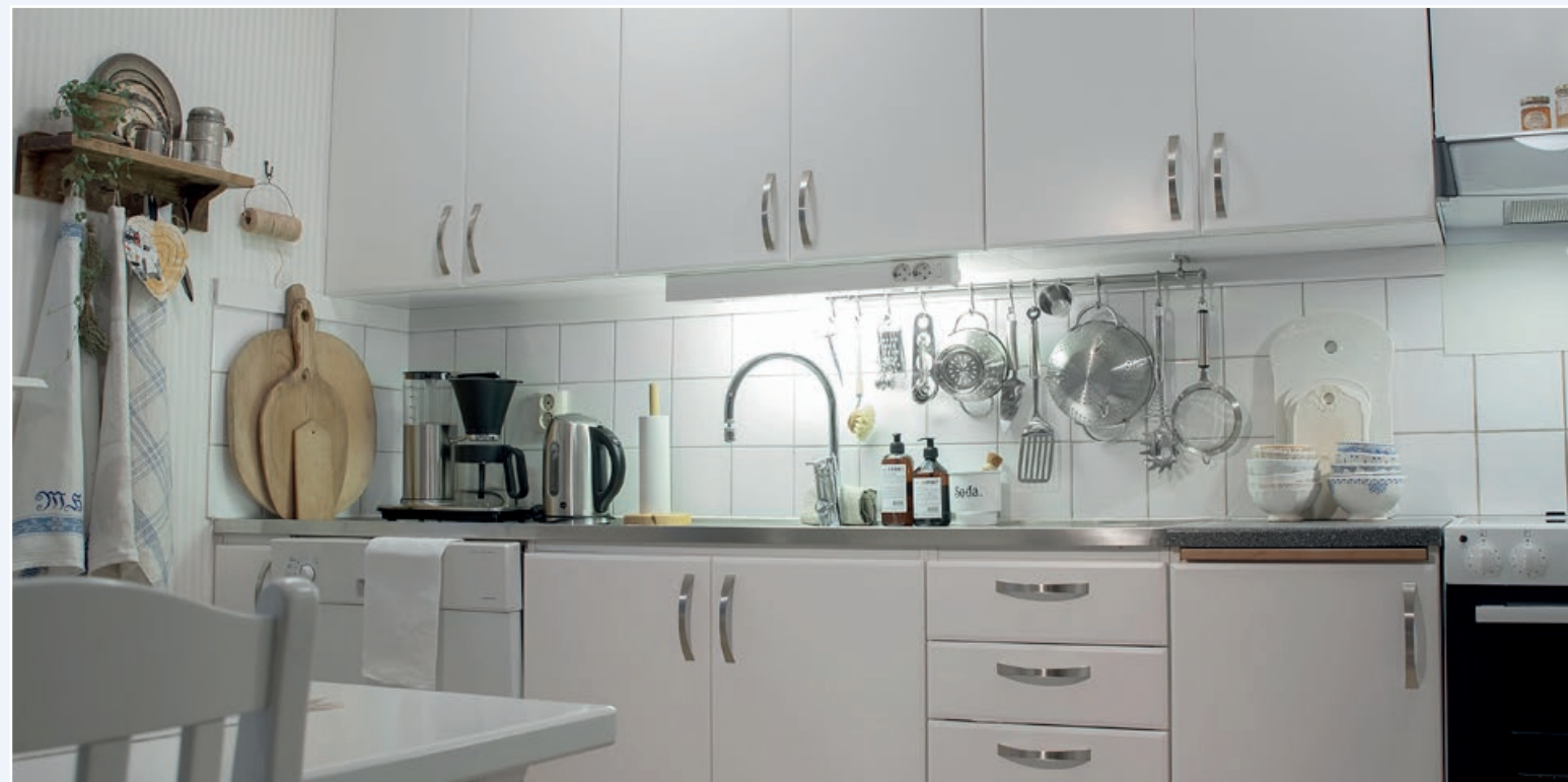
Vita luckor och grå bänkskivor i Guns nyrenoverade kök.