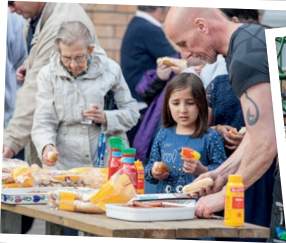
Den 22 maj 2017 invigdes lekplatsen i kvarteret Tuppen på Belfragegatan 34.