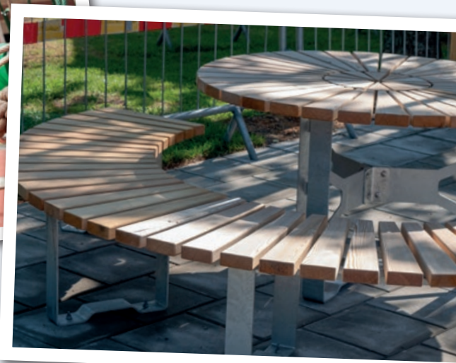
Den 1 juni 2018 invigdes lekplatsen i kvarteret Vipan på Kastanjevägen 3-55.