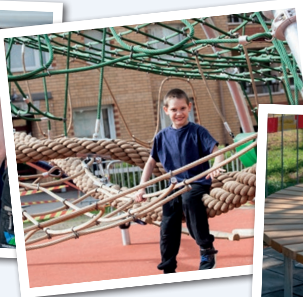
Här finns något för alla. Klätterställning, gungor, bekväma utemöbler, en skuggande pergola och en platsbyggd grill.