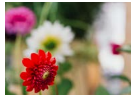
I cirkelarna kommer också blommor att planteras och vi har valt sorter som blommar länge.