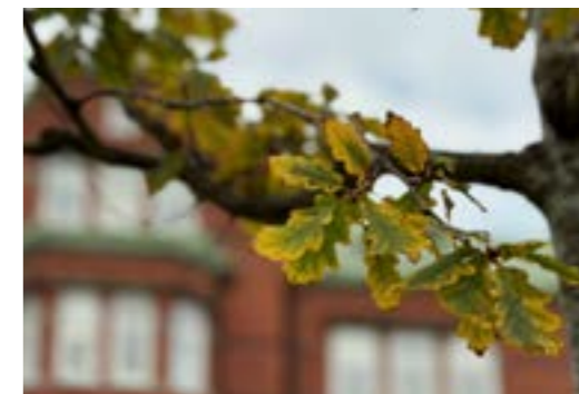
Fågelbärsträden och bergekarna som planteras i cirkelarna ska skugga fasaden och bidra till ett jämnare inomhusklimat.