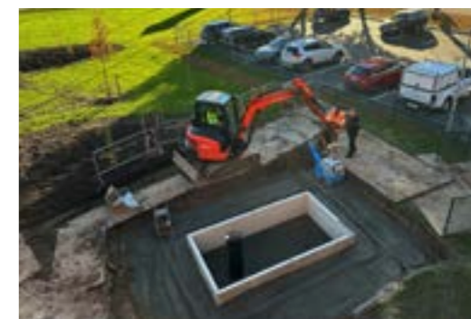
De nedsänkta regnbäddarna hindrar gräsmattan från att svämma över och stoppar vattnet från att rinna in i källaren vid skyfall.